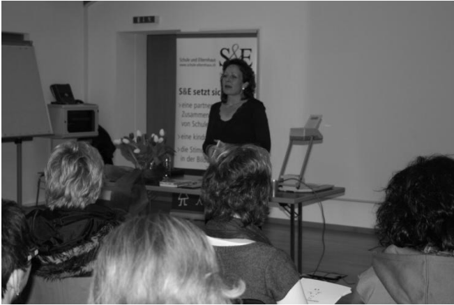
Vortrag „Gewaltfreie Kommunikation – Die Giraffenfamilie“

Konflikte angehen kann. Schritt für Schritt erklärte sie, wie man anhand des Gewaltfreie Kommunikationsmodell: Beobachtung, Gefühle, Bedürfnisse, Bitten/Fragen, die entsprechenden Lösungen findet.